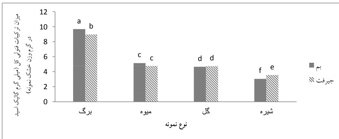
شکل ۱: مقایسه میزان ترکیبات فنل کل عصاره‌های متانولی برگ، میوه، گل و شیره گیاه استبرق در دو منطقه بم و جیرفت