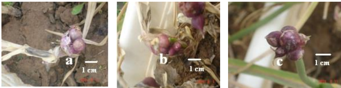
شکل ۲. تشکیل سیرچه‌های هوایی در طوقه (a) و انتهای ساقه (b, c) برخی از کولتیوارهای مورد مطالعه.

** و * همبستگی در سطح ۱ و ۵ درصد معنی دار می‌باشد.