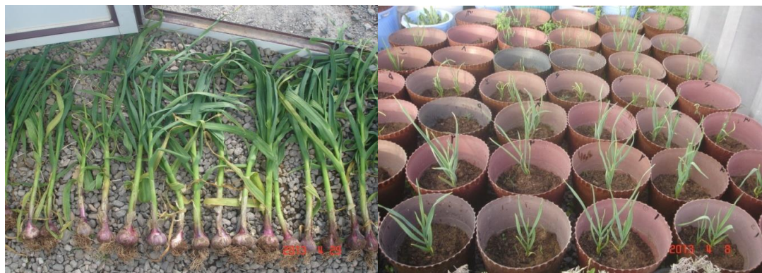
شکل ۱. بخشی از کولتیوارهای کشت شده در گلدان ۳ ماه پس از کشت (راست) و سیرهای برداشت شده (چپ) در پایان فصل